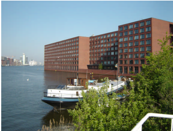
Appartementen complex Bogortuin aan het IJ in Amsterdam